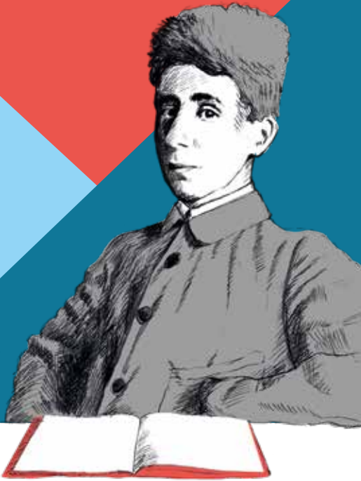
Illustration & Design: www.nontraktigle.de